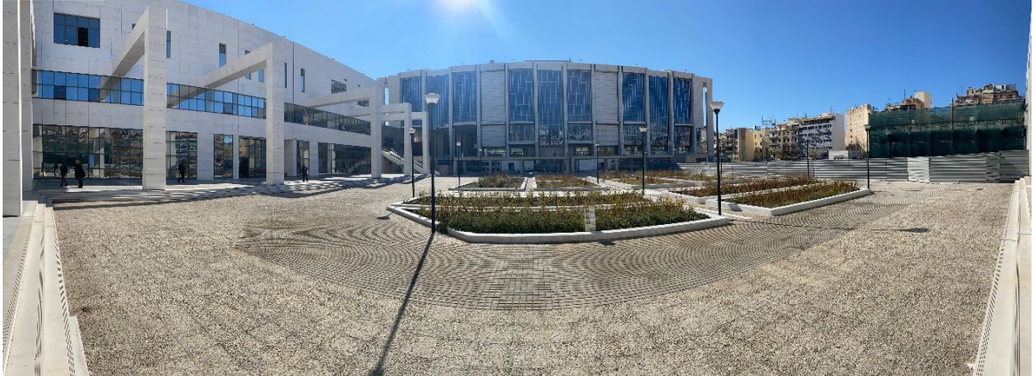
Φωτογραφία 1: Το τμήμα του Ακινήτου εντός του οποίου προβλέπεται η ανέγερση των κτηρίων του Πρωτοδικείου και της Εισαγγελίας Αθηνών.